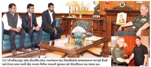
MSUની ઈન્સ્ટિટ્યુટ ઓફ લીડરશિપ એન્ડ ગવર્નન્સના ચાર વિદ્યાર્થીઓએ અભ્યાસક્રમના ભાગરૂપે દિલ્હી ખાતે દેશના સત્તા સુધી જનરલ બિપિન રાવતની મુલાકાત લઈ લીડરશિપના પાઠ જણાવ્યો હતો. બેરિટિવ લીડરશિપ ટ્રકી લેવ છે, જ્યારે એગ્રેટિવ લીડરશિપ ટ્રકી શક્તિ તબીબી રીતિન સહાયે પોલિટિકલ લીડરશિપ વિશે જણાવ્યું હતું છે. પોલિટિકલ લીડરશિપ એક સ્વાભાવિક હોય છે અને સામાન્યતઃ મેન્ટલ કરી રાખવા માટે કમર બંધ કરે છે. જેમાં તેમણે ઈન્ડિયન ગ્રામીન લીડરશિપ કમ્યુનિટી ડેવલપમેન્ટ પ્રોગ્રામના ઈલેક્ટ્રોનિક ઈલેક્ટ્રોનિક અને એગ્રેટિવ લીડરશિપ અને એગ્રેટિવ લીડરશિપ વિશે સમજાવ્યું હતું. એગ્રેટિવ લીડરશિપ સાથે સમગ્ર સુધી ટ્રકી શક્તિ નથી. કારણ કે, તેમાં સ્વામી હોય છે અને એક ટિપ્પણીને હોય છે. દેશની રીલિટિ પ્રમાણે ગવર્નમેન્ટનું પબ્લિકિટી પાર્ટમાં સુધારે કરવું જરૂરી રીતિન સહાયે જણાવ્યું હતું છે. દેશની હાલની રીલિટિ ગવર્નમેન્ટના પબ્લિકિટી પાર્ટને રીફોર્મ કરવાની હોય છે. કારણે લોકો તેનો ઉપયોગ કરવામાં માટે રહ્યા છે. જેના કારણે લોકોની મુશ્કેલીનું નિકાસ કરવામાં આવે તેમાં વધારો થઈ રહ્યો છે. આ કિસ્સા દેશના બુલેટીની લોકો જ સાચાં કાંઈ નથી. જ્યારે જનતામાં પોતાના કાંઈ કાંઈ જાણુકા હશે, જનતા પોતાની મુશ્કેલીને સરકાર સમજાવતી હશે ત્યારે જ બંને પક્ષોની બુલેટીની સાર્વક મળે.

એમ.એસ.યુનિવર્સિટીની ઈન્સ્ટિટ્યુટ ઓફ લીડરશિપ એન્ડ ગવર્નન્સના ચાર વિદ્યાર્થીઓને અભ્યાસક્રમના ભાગરૂપે દિલ્હીમાં રાજ્ય આર્મી ચીફ જનરલ બિપિન રાવતની મુલાકાત લીધી હતી. જેમાં તેમણે વિદ્યાર્થીઓ સાથે લીડરશિપના વિષય પર વિશેષ એક કક્કા સુધી ચર્ચા કરી હતી. ઈન્સ્ટિટ્યુટ ઓફ લીડરશિપ એન્ડ ગવર્નન્સના વિદ્યેષ પોલિટી, યુવરશિપ, સો. ડિપાર્ટમેન્ટના અને સાથે સાથે 110 સુવૃદ્ધિન સેનર દેવાના રાજ્ય આર્મી ચીફ જનરલ બિપિન રાવતની મુલાકાતે નવા હતા. બિપિન રાવતના પ્રદેશ દરેક વ્યક્તિમાં એક નવા હોય છે, પણ તેને શોધવાની જરૂર હોય છે. દરેક વ્યક્તિને નેચરલ ક્વાલિટી જ હોય છે. આ માટે તેને સમજાવવાની હોય છે. આ કિસ્સાને તેમણે નક્કરપણે લીડરશિપ, લક્ષ્યસ્થિત લીડરશિપ, પબ્લિકિટી ડિવિઝન અને બુલેટીની વિશેષતા જણાવી હતી.