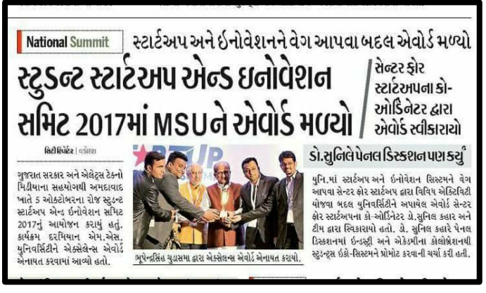
October 06, 2017, Divya Bhaskar, Start Up Summit