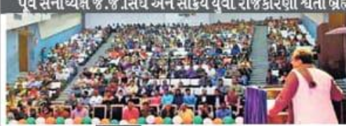
પૂર્વ સેનાધ્યક્ષ જી.જે.સિંઘ અને સક્રિય યુવા રાજકારણી ચેતા બ્રહ્મભટ્ટે વિદ્યાર્થીઓને સંબોધ્યા

વિદ્યાર્થીઓ આજના દેશની ઘોર ભ્રષ્ટ્રતા અને ન્યાયની અછૂનકતાને કારણે ભારતને એક લાગણીમય દેશ બનાવવાની જરૂર છે. આજના દેશમાં મૂલ્યોની કમીને કારણે એકતા રહેશે નહીં. મૂલ્ય વ્યવસ્થા હશે ત્યાં સુધી દેશમાં એકતા રહેશે. આજના દેશમાં મૂલ્યોની કમીને કારણે એકતા રહેશે નહીં. મૂલ્ય વ્યવસ્થા હશે ત્યાં સુધી દેશમાં એકતા રહેશે.