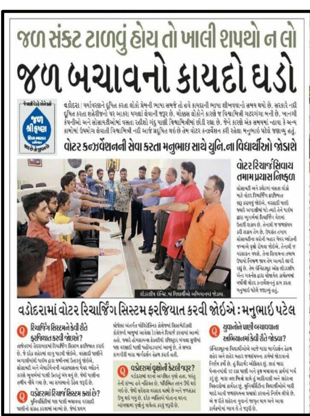
May 25, 2018, Divya Bhaskar, Jal Bachavo