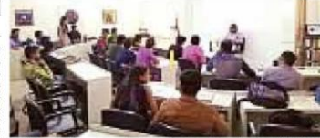
વિદ્યાર્થીઓને ગાંધી ફિલ્મ બતાવ્યા બાદ તેમની પાસે ગાંધીજી એ આજે હોય તો કેમ હોઈ? સુ કિલિટ હોય તેવા વિષયો પર મનોમો વેવામાં આવ્યા હતા. ત્યારે તેમણે જે મંતવ્ય આપ્યા હતા તે પૈકીની કેટલીક અમુક છે.