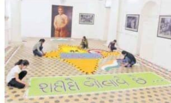
શહીદ અંતિમ માને વિશ્વભરમાં કાઢવામાં આવેલા શહીદોના યાદમાં MSUમાં દિવાલ પેઇન્ટ થશે અને મશાલ યાત્રાની શરૂઆત કરવામાં આવશે.

Saheed Katha શહીદોના યાદમાં દિવાલ પેઇન્ટ કરવામાં આવશે અને મશાલ યાત્રાની શરૂઆત કરવામાં આવશે.