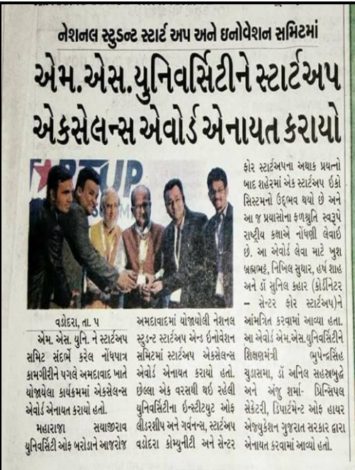
October 06, 2017, Start Up Summit