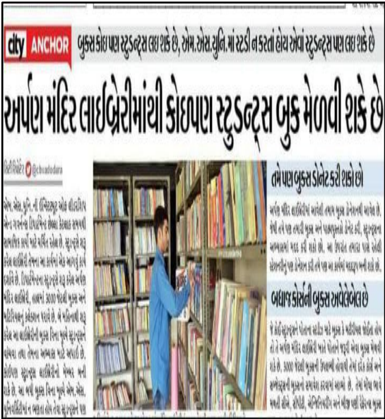
May 23, 2018, Arpan Mandir, ILG